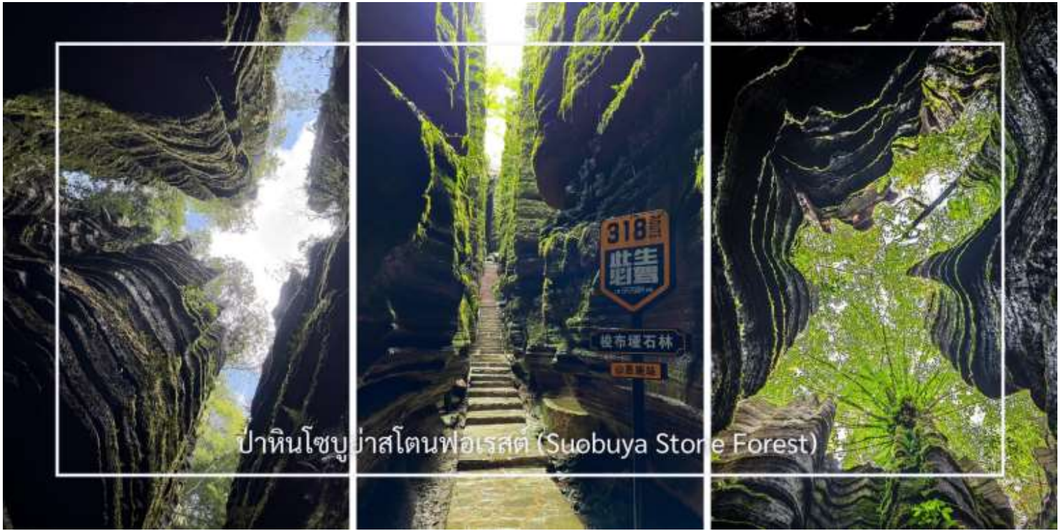
ป่าหินโซบูยา สโตนฟอเรสต์ (Suobuya Stone Forest)