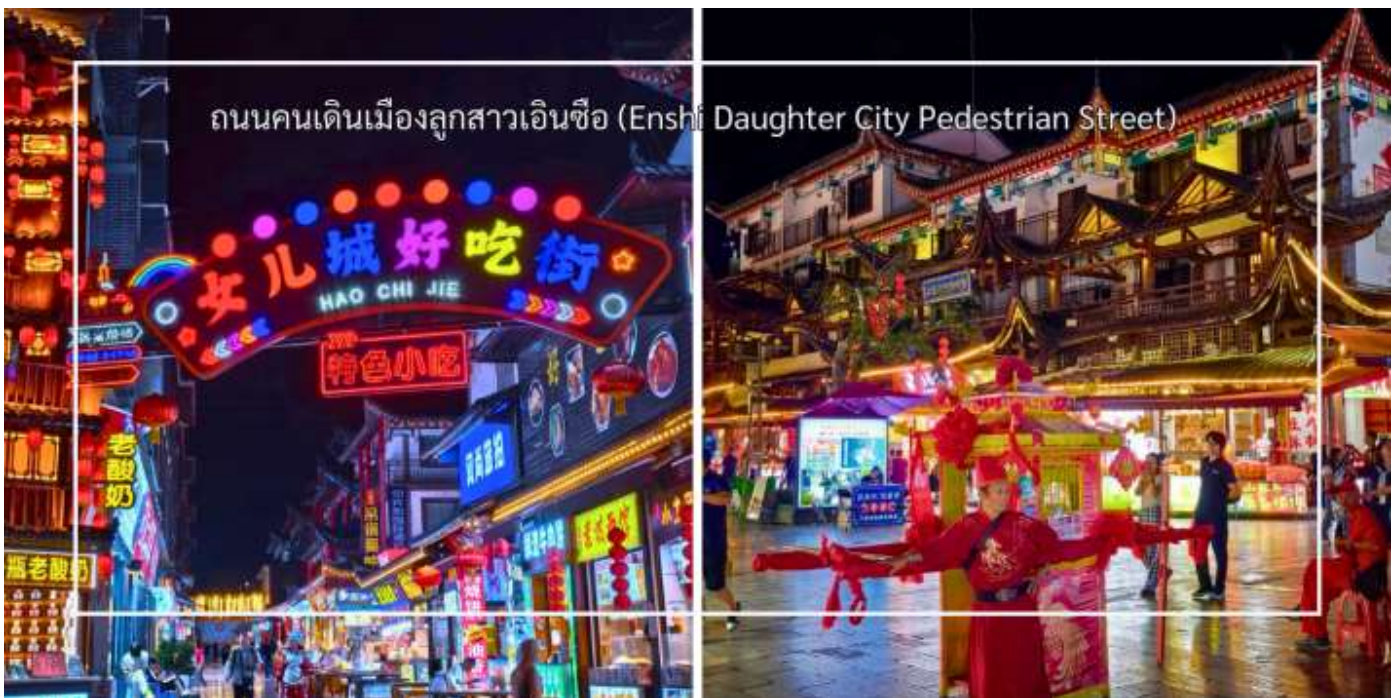
ถนนคนเดินเมืองลูกสาวเินซือ (Enshi Daughter City Pedestrian Street)

ที่นี่เรียกอีกชื่อว่า ถนนคนเดินเมืองลูกสาวเินซือ เป็นศูนย์กลางกิจกรรมท่องเที่ยวที่เต็มไปด้วยสีสันและวัฒนธรรมของเินซือ ถนนเส้นนี้เต็มไปด้วยร้านค้า ร้านอาหาร และแผงขายสินค้าพื้นเมือง ทั้งของฝาก งานหัตถกรรม และอาหารท้องถิ่น ทำให้นักท่องเที่ยวได้สัมผัสวิถีชีวิตของคนท้องถิ่นอย่างใกล้ชิด บรรยากาศในยามค่ำคินมีชีวิตชีวา แสงไฟประดับถนนสวยงามตัดกับภูมิทัศน์เมืองเก่า และมีมุมถ่ายภาพสวยๆ ให้ผู้มาเยือนได้เก็บความประทับใจ