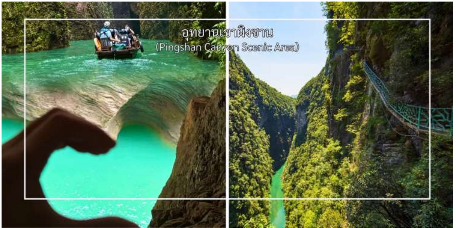
อุทยานเขาผิงซาน (Pingshan Canyon Scenic Area)