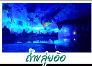
ถ้ำฟู้อ้อ

เขารู้อี+สะพานแดง - ล่องเรือแม่น้ำหลีเจียง นาจันบับไดสีกองอรัม - กำฟู้อ้อ - เขางวงช้าง เจดีย์เงินเจดีย์ทอง - รถไฟความเร็วสูง หมู่บ้านพิเศษ บูฟฟี่ต๋องบาร์บิวี่ ปลาอบเบียร์ เผือกคริสตัล สุกี้เห็ด