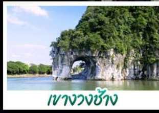
เขางวงช้าง