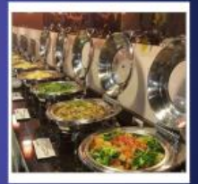
RENYI LAKE HOTEL

หมายเหตุ: **ปัจจุบันโรงแรมได้หวั่นมีนโยบายเพื่อลดโลกร้อน ตั้งแต่ปี 2568 เป็นต้นไป** โรงแรมที่พักงดบริการแจก สบู่ แชมพู ครีมนวด และผลิตภัณฑ์ดูแลผิวส่วนรวม *สิ่งที่ต้องเตรียมของใช้ส่วนตัวไปเอง! ครีมนวด แชมพู ครีมนวด โลชั่น หมวกอาบน้ำ หวี แปรงสีฟัน ยาสีฟัน และของใช้ส่วนตัวอื่นๆ เพื่อสุขอนามัยที่ดีและเป็นมิตรกับโลกลดโลกร้อนรักษ์โลก...พกของใช้ส่วนตัว สบายใจ ไร้กังวล