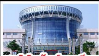
พิพิธภัณฑ์กังวาลี่

สวนสนุก FANTASYLAND - หมู่บ้านสไตล์ยุโรป พิพิธภัณฑ์กังวาลี่ - ถนนคนเดินสามตรอกสองซอย ท่าเรือกิ่งจื่อ - ศาลเจ้าแม่กวนอิมพันกร เมนูพิเศษ อาหารกังวาลี่ , สุกีชาบูหม่าล่า