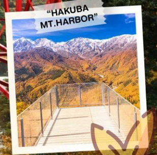
"HAKUBA MT. HARBOR"

วันเดินทาง 28 ต.ค. - 3 พ.ย. 2569 4 - 10 , 11 - 17 พ.ย. 2569