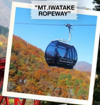
"MT. IWATAKE ROPEWAY"