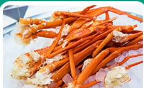
พิเศษ! บุฟเฟ่ต์ขาปู