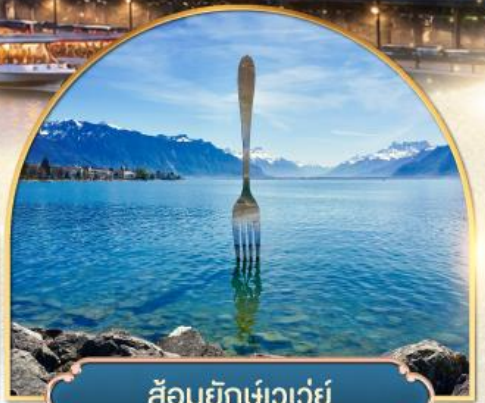
ล้อมยักเขาวัว