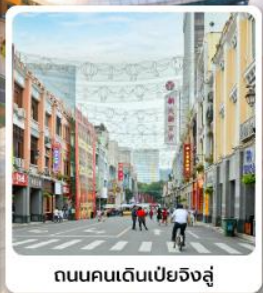
ถนนคนเดินเป่ย์จิงสู๋