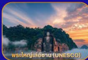
พระใหญ่เล่อซาน (UNESCO)

ล่องเรือชม "พระใหญ่เล่อซาน" - เมืองโบราณหวงหลงซี - แพนด้าเซลฟี - ห้องสมุดจงซูเกอ - Wangjianglou Park - ถนนชุนซีลู่ (แหล่งซ้อป๋ิง) - IFS (แพนด้าปิ่นตึก) - วัดต้าจื่อ