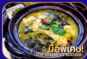
มีอพิเคซ! ปลาต้มผักกาดดอง