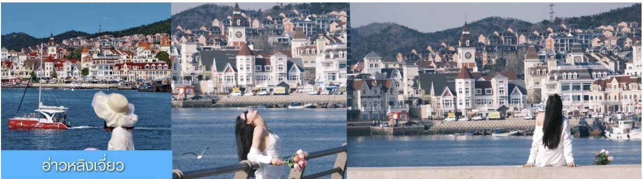
อ่าวหลังเจี้ยว

จากนั้นนำท่าน เที่ยวชม ท่าเรือประมงหู่ทาน 大连渔人码头 เป็นจุดเช็คอินที่โดดเด่นด้วยสถาปัตยกรรมสไตล์ยุโรปสีสันสดใส ผสมผสานกลิ่นอายเมืองท่าดั้งเดิมเข้ากับบรรยากาศสุดโรแมนติคที่เต็มไปด้วยเรือประมง คาเฟ่ ร้านอาหาร และจุดชมวิวยุริมาทะเล