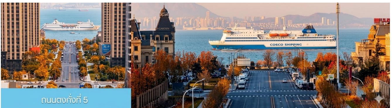
ถนนกั๋งตงที่ 5