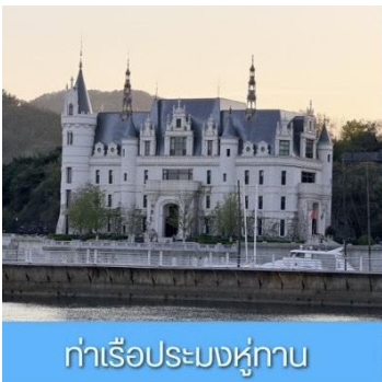
ท่าเรือประมงหู่กาน

พักที่ DALIAN JUZISHUIJING HOTEL / SANSHUI HOTEL โรงแรมระดับ 4 ดาวท้องถิ่น ต้าเหลียน