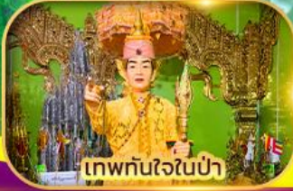
เทพทันใจในป่า