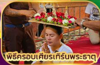
พิธีครอบเศียรเทิร์นพระธาตุ