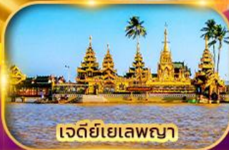
เจดีย์เยเลพญา