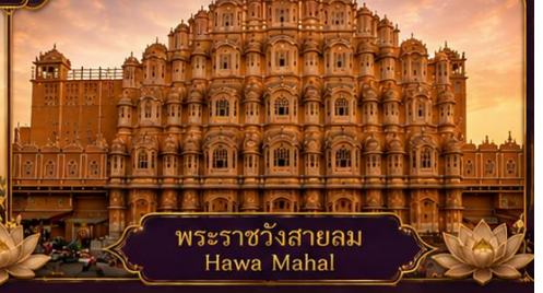
พระราชวังสายลม Hawa Mahal