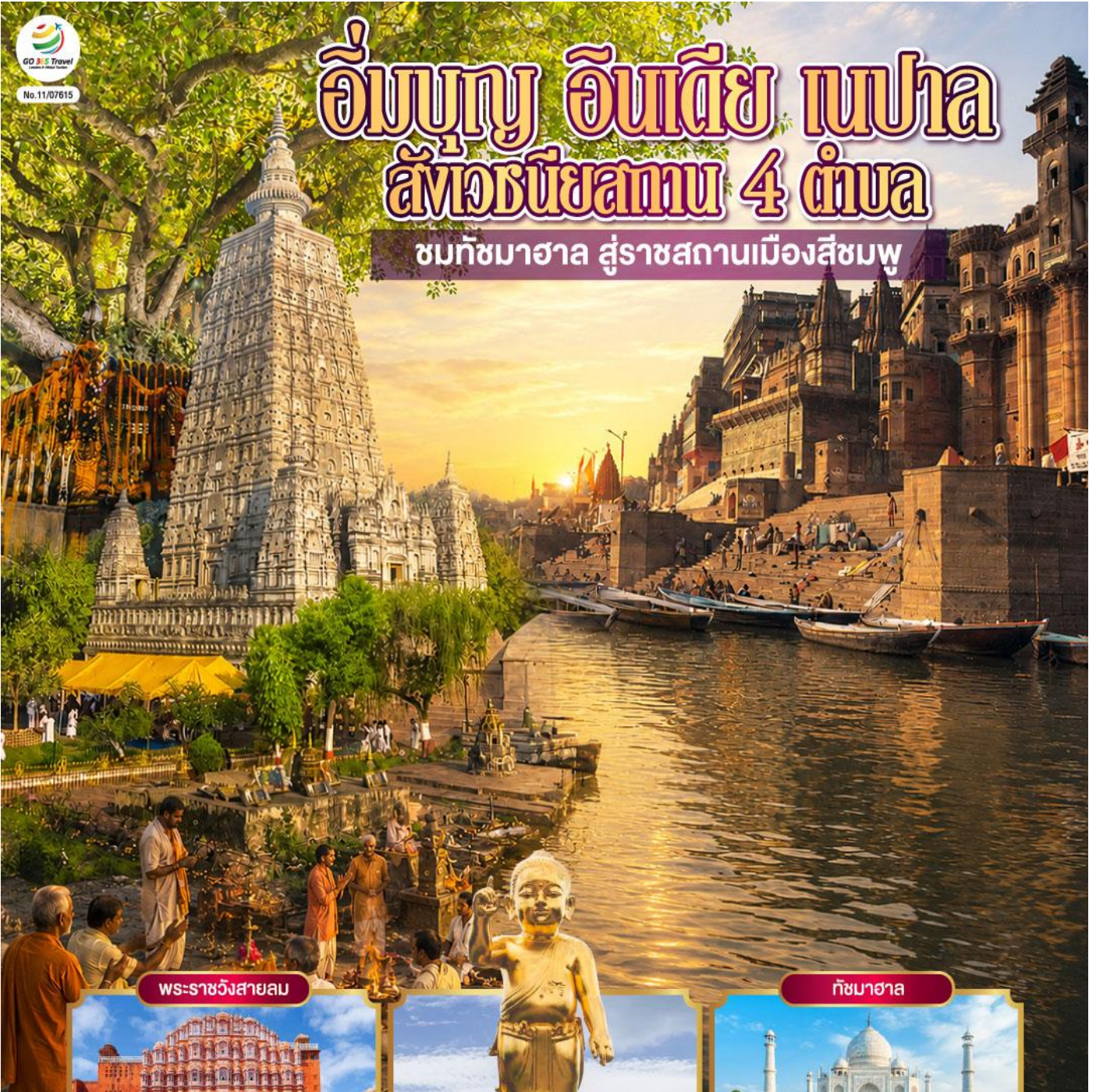
พระราชวังสายลม