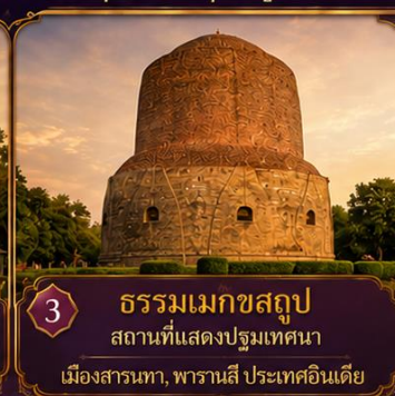
3 ธรรมเมกขสถูป สถานที่แสดงปฐมเทศนา เมืองสารนาถ, พาราณสี ประเทศอินเดีย