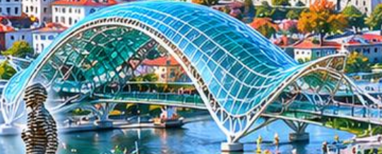
BRIDGE OF PEACE สะพานสันติภาพ