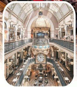
QUEEN VICTORIA BUILDING