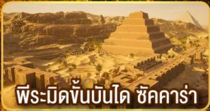
พีระมิดขั้นบันได ชิคคาร์่า