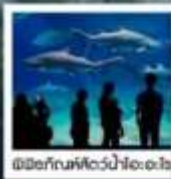
พิพิธภัณฑ์สัตว์น้ำโอเอะไร