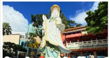
เจ้าแม่กวนอิมรัฟส์เบย์