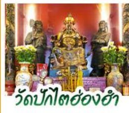
วัดปึกโท่องฮ่า