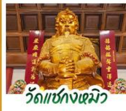
วัดเข่งหนิว