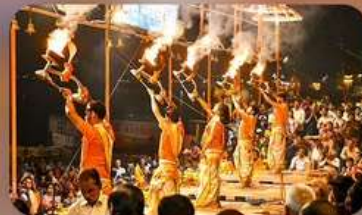
พิธีสงคา อารตี