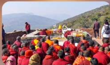
เขาคิชฌกูฏ