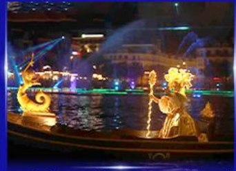
ชมโชว์เวนิสจำลอง แกรนด์เวิลด์