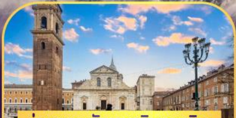
ถ่ายภาพกับมหาวิหารตูริน