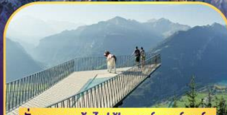
นั่งรถกระเช้าไฟฟ้า ฮาร์เตอร์ คูลัม