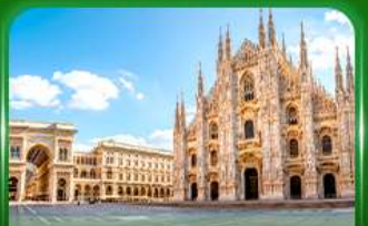
มหาวิหารดูโอโมแห่งมิลาน