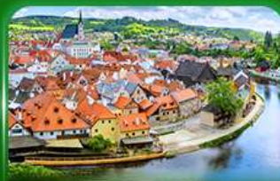
เมืองมรดกโลก เซสกีครุสอพ