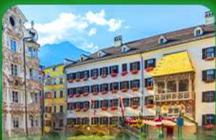
หลังคาทองคำ อินส์บรุค