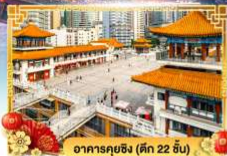
อาคารคุยซิง (ดิค 22 ชั้น)