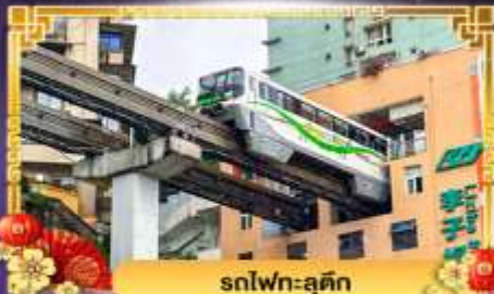
รถไฟฟ้า-ลูตึก