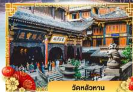
วัดหลัวฮาน