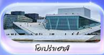
โอเปร่าเฮาส์

เดินทาง 07-15 ต.ค.69 / 16-24 ต.ค.69 13-21 พ.ย. 69 / 04-12 ธ.ค. 69 25 ธ.ค. 69 - 02 ม.ค. 70 (ปีใหม่)