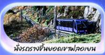
นั้งรถรางขึ้นยอดเขาฟลอมเฮน

เปิดประสบการณ์สุดว้าว... สักครั้งในชีวิต! ล่องเรือชมฟยอร์ด นั่งรถไฟสายโรแมนติกฟลอมสบาน่า เบอร์กิน ชมเมืองเก่าบรีคเกน นั่งรถรางขึ้นยอดเขาฟลอมเฮนชมวิวเมือง ไมควรฟลาดนัง Cable car ขึ้นยอดเขาอูลริเคน ชม Top view ตระการตา ความอลังการระดับมาสเตอร์พีซ จุดชมวิวดัสตากาสดัน เดินเล่นตลาดปลาเบอร์กิน ขึ้นชมโบสถ์ออสโลเยี่ยมชมโอเปร่าเฮาส์ มหาวิหารออสโล ป้อมปราการอาครส์ฮุส รัฐสภาแห่งนอร์เวย์ สวนอนุสรณ์ชาติ Vigeland Sculpture Park ซุปป์ิงถนน Karl Johans gate