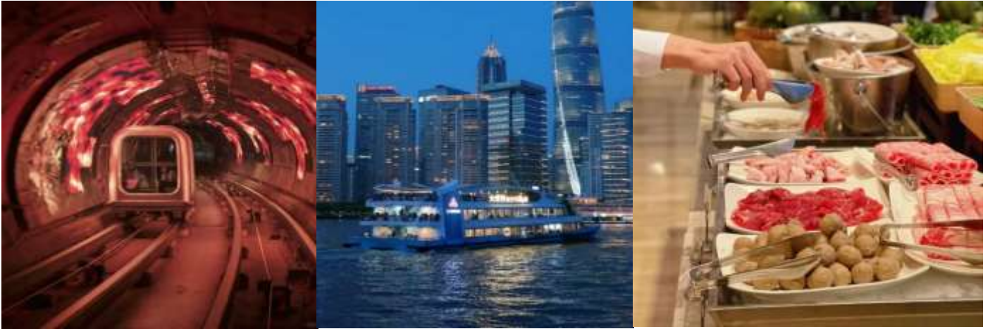
**อิสระรับประทานอาหาร

สัมผัสความทันสมัยและเสน่ห์ของมหานครเซี่ยงไฮ้ เริ่มจากขึ้นชมวิวบน ตึกเซี่ยงไฮ้เซ็นเตอร์ ตึกที่สูงที่สุดในจีน ก่อนนั่ง อุโมงค์เลเซอร์ ลอดใต้แม่น้ำหวงผู่ พร้อมตื่นตาตื่นใจกับแสง สี และเอฟเฟกต์สุดล้ำ อิ่มอร่อยกับ บุฟเฟ่ต์ชาบูในโรงแรม Renaissance ปิดท้ายด้วย ล่องเรือแม่น้ำหวงผู่ยามค่ำคืน ชมความสวยงามของเส้นขอบฟ้าเซี่ยงไฮ้และแสงไฟจากแลนด์มาร์กทั้งสองฝั่งแม่น้ำ บรรยากาศโรแมนติกและน่าประทับใจจนยากจะลืม