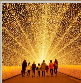
"NABANA NO SATO"