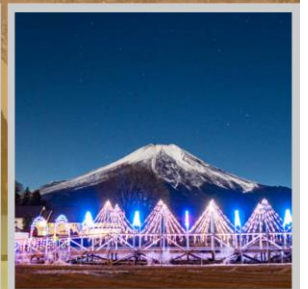
"YAMANAKAKO ILLUMINATION FANTASEUM"