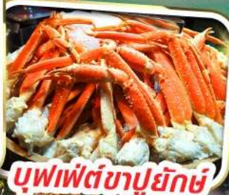
บุฟเฟ่ต์ซาปูยักษ์