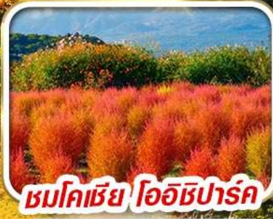
ชมโคเชีย โออิชิปาร์ค