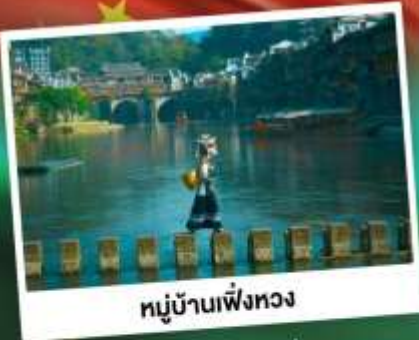
หมู่บ้านเฟิงหวง

สุดคุ้ม!! พัก 5 ดาว ทุกคืน มนต์เสน่ห์เมืองเก่า ริมสายน้ำแห่งขุนเขา