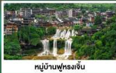
หมู่บ้านฟุหลงเจิน