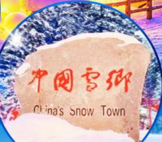
ป้ายหินใหญ่เมืองหิมะ