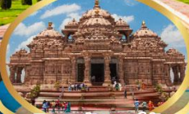
วิหารอักซาร์ดีม