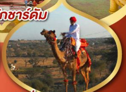
ฟรี ขี่อูฐ เมืองมันทาวา ราคาเริ่มต้น