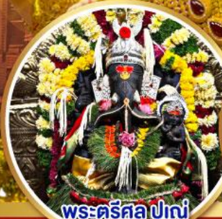
พระตรีศูล ปูणे (Trishul Pune)