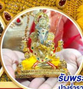
รับพระพิฆเนศ ปางรำรอย ท่านละ 1 องค์