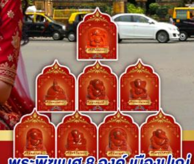
พระพิฆเนศ 8 องค์ เมืองปูणे