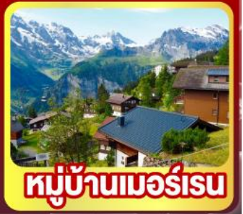
หมู่บ้านเมอร์สเรน