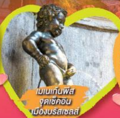
เบเนกัมพัส จุดช็อคคอน เมืองบรัสเซลส์