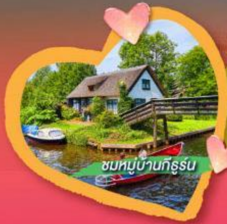
ชมหมู่บ้านกังหัน