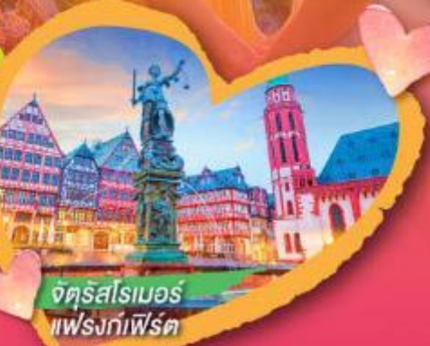
จัตุรัสโรเมอร์ แฟรงก์เฟิร์ต